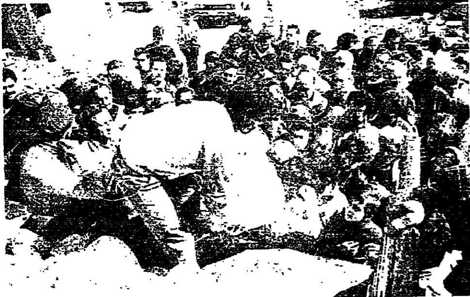
المساعدات في حي السموط في عين الرمانة